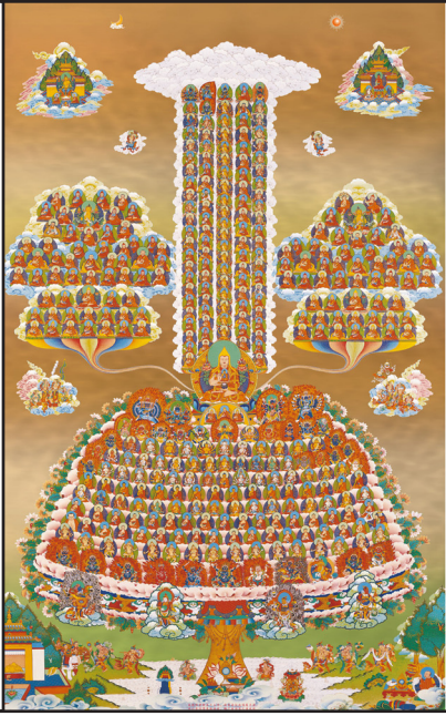
Las cientos de deidades de Tushita